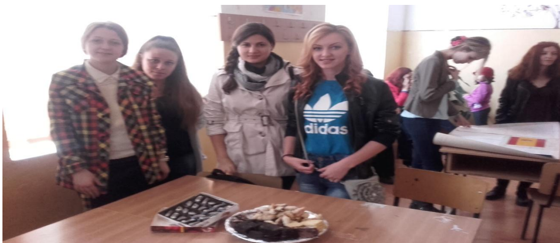
Echipaj – BELGIA (clasa a XI-a E)