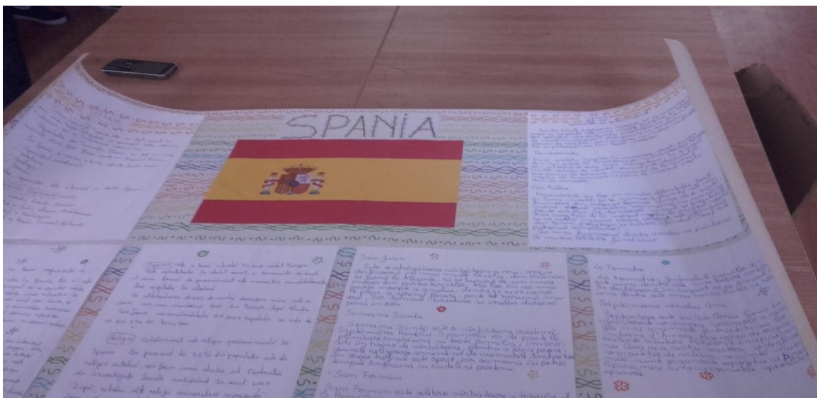
Poster – SPANIA (clasa a IX- a F)