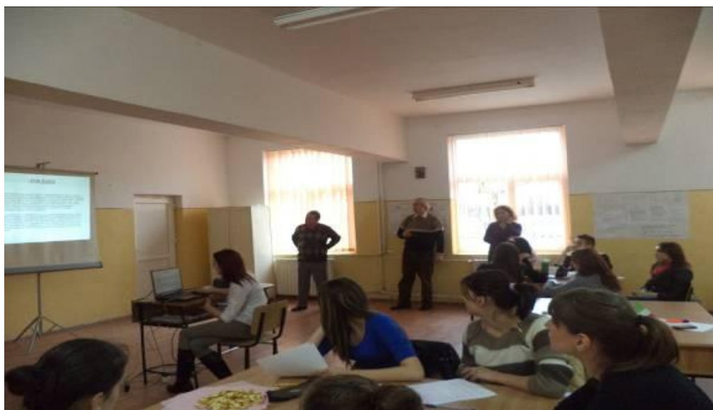
Împreună cu reprezentantul I.S.J. Dâmbovița și directorul liceului la activitatea concurs