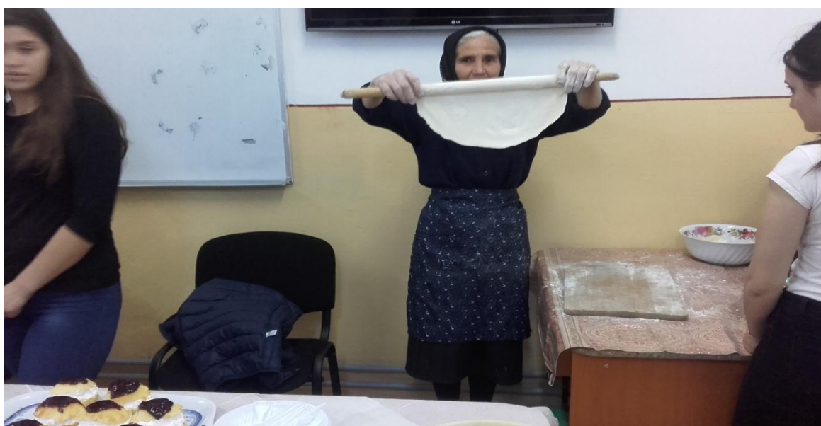
Echipaj – ROMÂNIA (clasa a XII-a C)