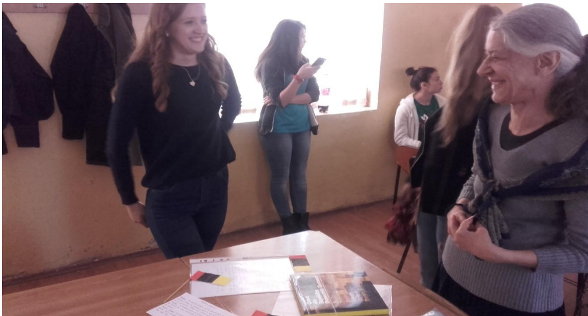
Echipaj – GERMANIA (clasa a X-a D)