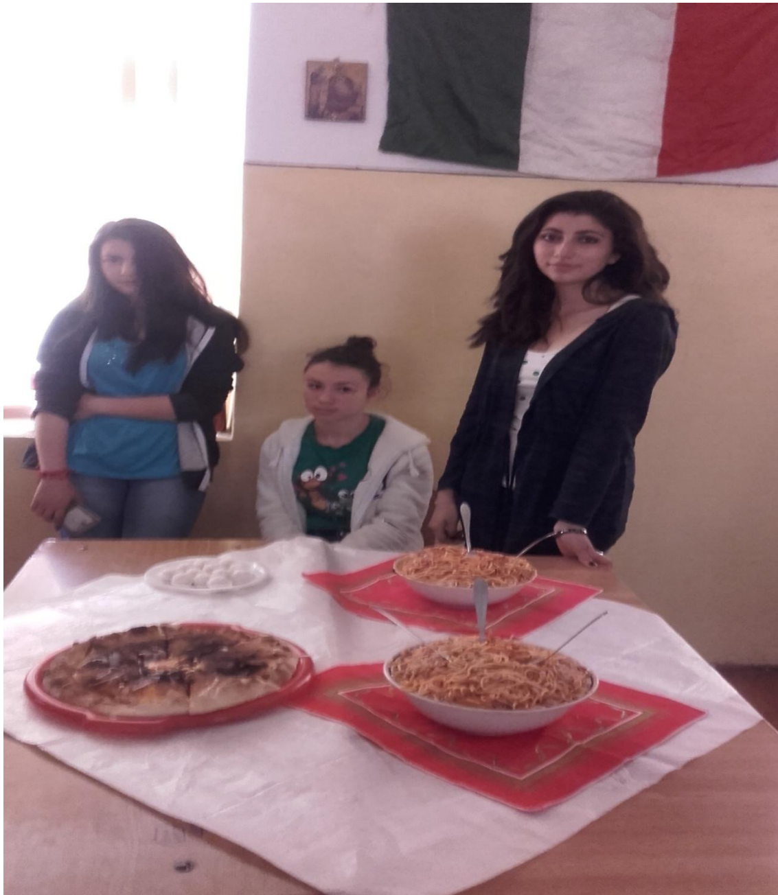
Echipaj – ITALIA (clasa a IX-a C)

LICEUL TEORETIC ION HELIADE RĂDULESCU TÂRGOVIȘTE