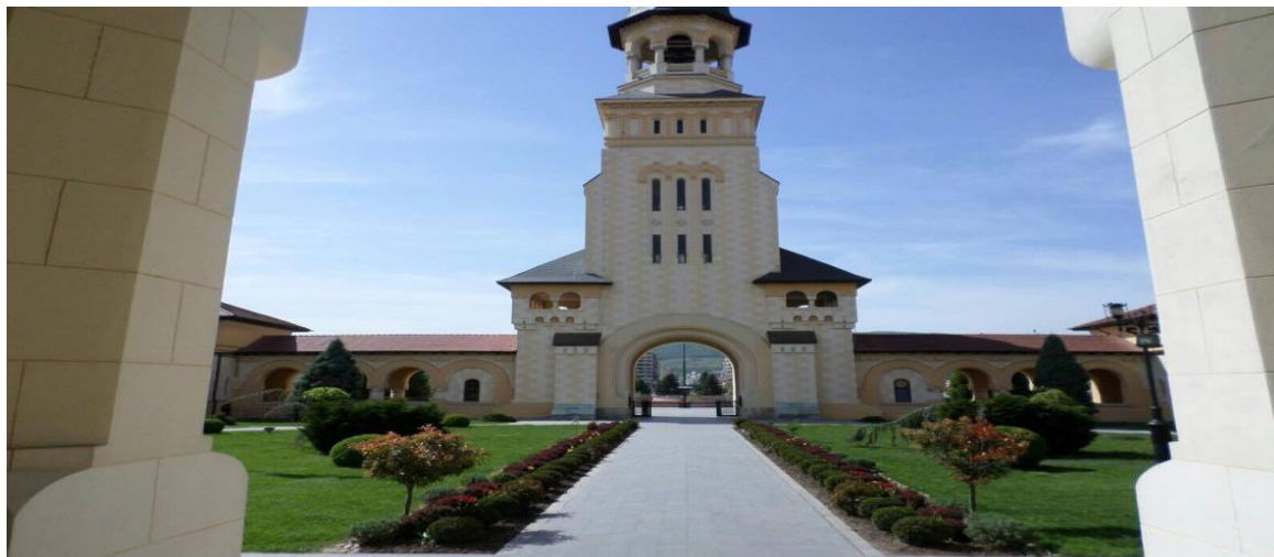
Cetatea Alba Iulia