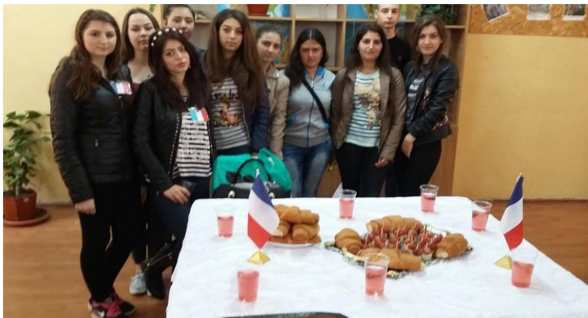
Echipaj – FRANȚA (clasa a X-a A)