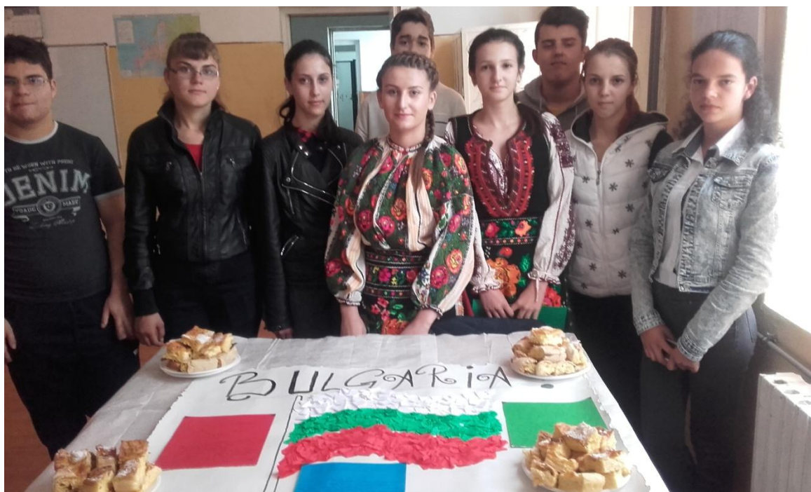
Echipajul câștigător – BULGARIA (Clasa a IX-a A)