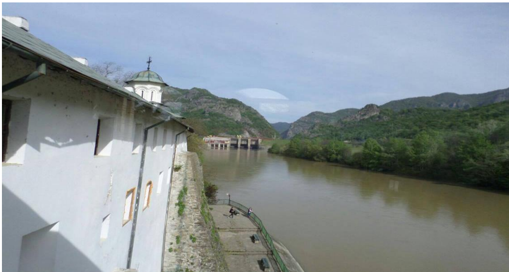
Oltul la Cozia